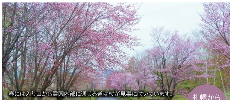
春には入り口から霊園内部に通じる道は桜が見事に咲いています。